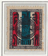
1 Baht 25 x 32mm Red & Blue green

Language 'cartouche' central, below servicemen in this case 5. Left ราคา 'Price' at right สตางค์ 'Satang'