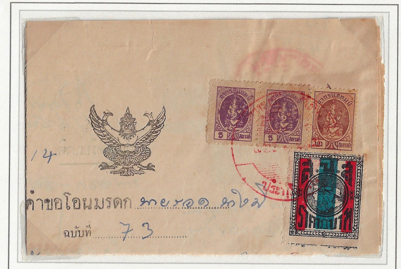
1 Baht used in conjunction with general revenue issues used for receipt, cheques, custom fees etc. Note both languages