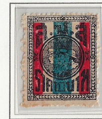
1 Baht 25 x 32mm Red & Week Print Bottle green

Satang Values: Perforated 11. 1 baht compound perforated 10.75 x 11.75