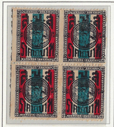
1 Baht Compound Perforated 10.75 x 11.75 Multiples appear scarce Vertical misplaced perms to the left