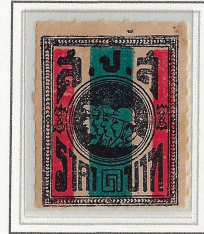
๑ 1 Baht 25 x 32mm