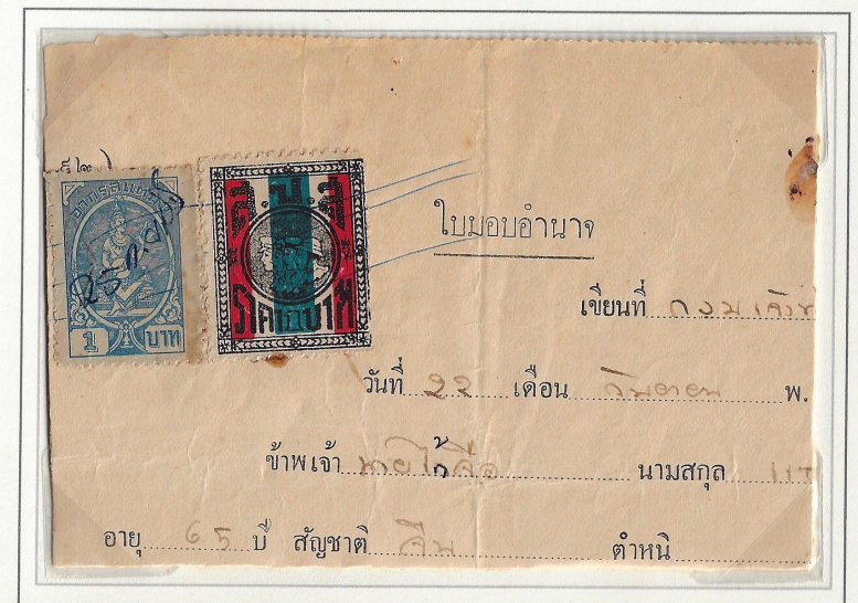
1 Baht used in conjunction with a blue 1 Baht general revenue