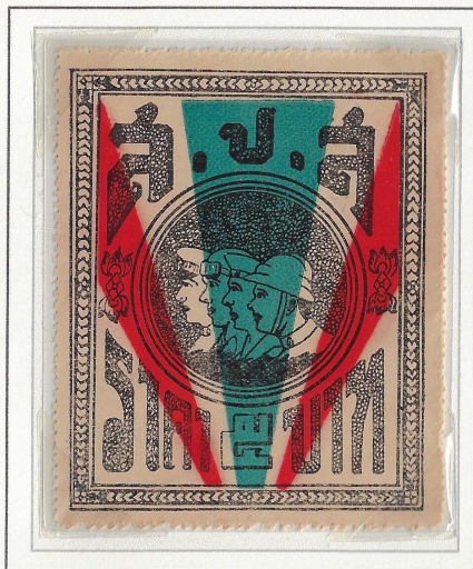
Grey, Dull Vermilion & Dull Slate Blue

As each 500 baht was collected it was to be sent to the Provisional Governor for dispatch on to the Chief of the Treasury in the Office of the Deputy Chief of the Ministry of the Interior