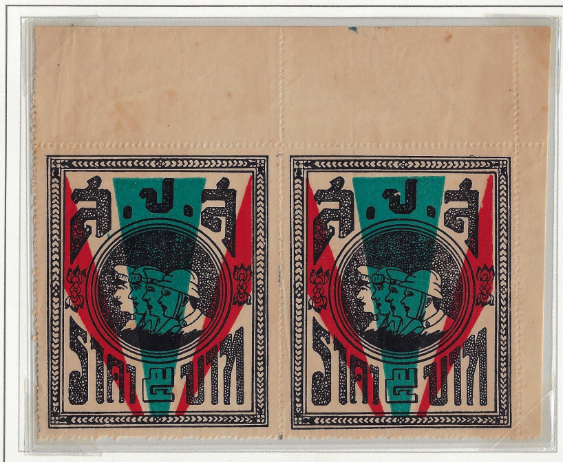
Black, Red & Dull Slate Blue