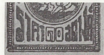
Language 'cartouche' central, below servicemen in this case ๑๐ 10. Left ราคา 'Price' at right สตางค์ 'Satang'

The existence of stamps with Thai and Arabic numerals can be explained. On 19 November 1942 Prime Minister Phibun Songkhram enacted a law stating that Arabic numerals would henceforth be the official numerals instead of Thai numbers. Thus all postage, revenue and other stamps printed thereafter were required to use Arabic numerals. That law was subsequently rescinded on 2 November 1944