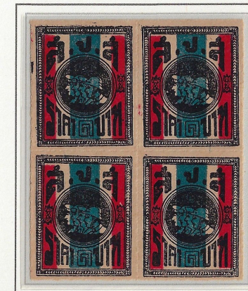
1 Baht Rouletted 6.25 Multiples appear scarce

All satang values were printed in sheets of 100 stamps 10 x 10. 1 baht, was printed in two sheet sizes viz: 90 10 x 9 and 100 10 x 10. All values had either a 4 or 5 digit Arabic sheet number in the upper right selvedge