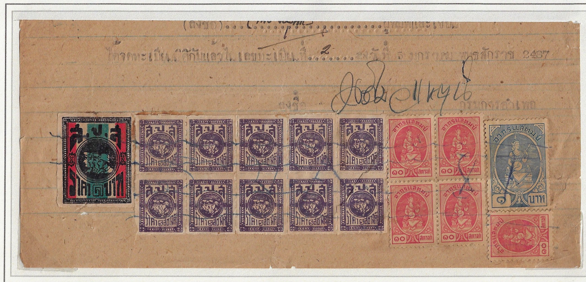
Thai numeral 1 Baht & Arabic numeral 5 Satang block 10