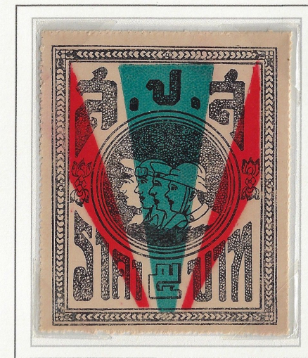
Grey, Orange Red & Dull Slate Blue

Rules Operating with S.P.S. Stamps: Affix S.P.S. stamps to documents or any other materials the donor wishes with the following suggestions: